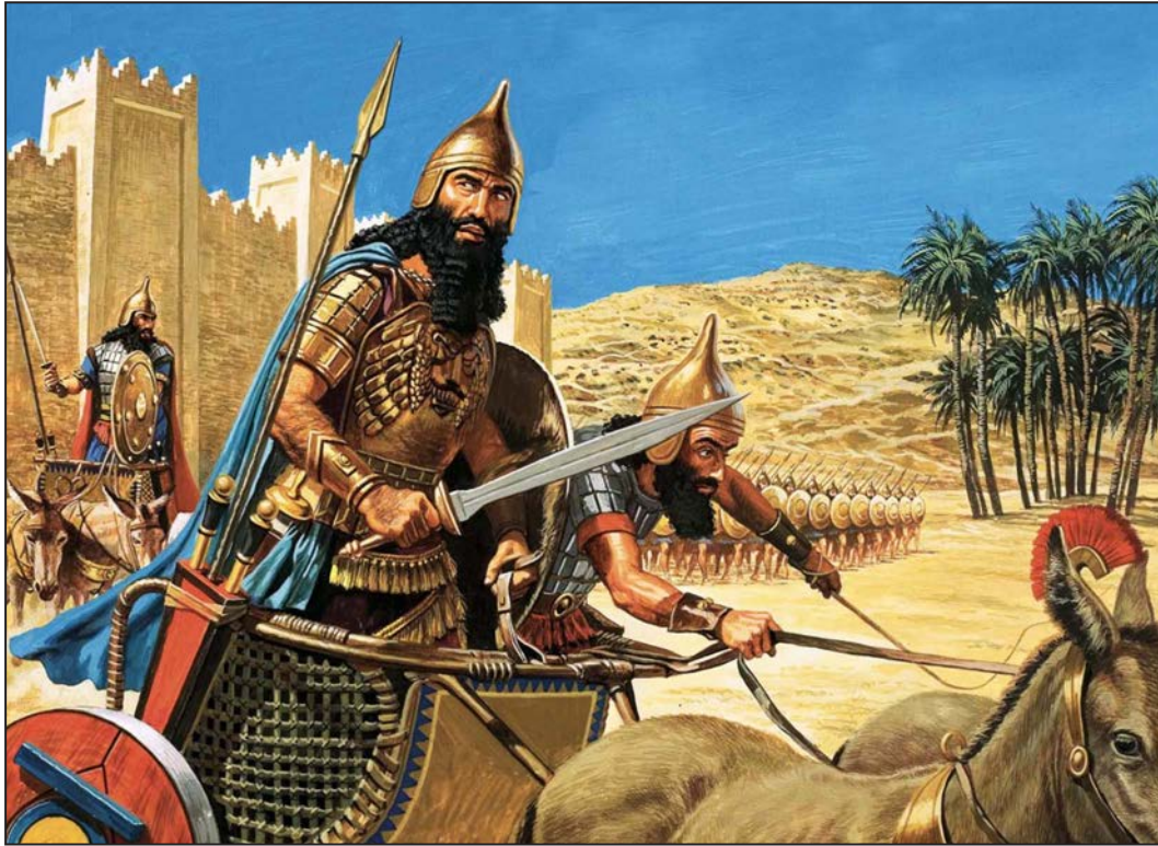
Kral Hammurabi savaşa gidiyor. Roger Payne