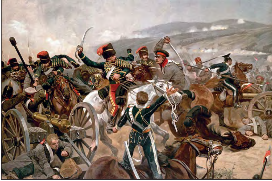
Hafif süvari alayının hücumu, 22 Ekim 1854