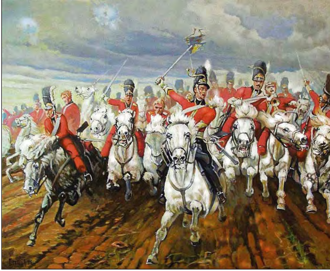
Hafif süvari alayının hücumu, 22 Ekim 1854