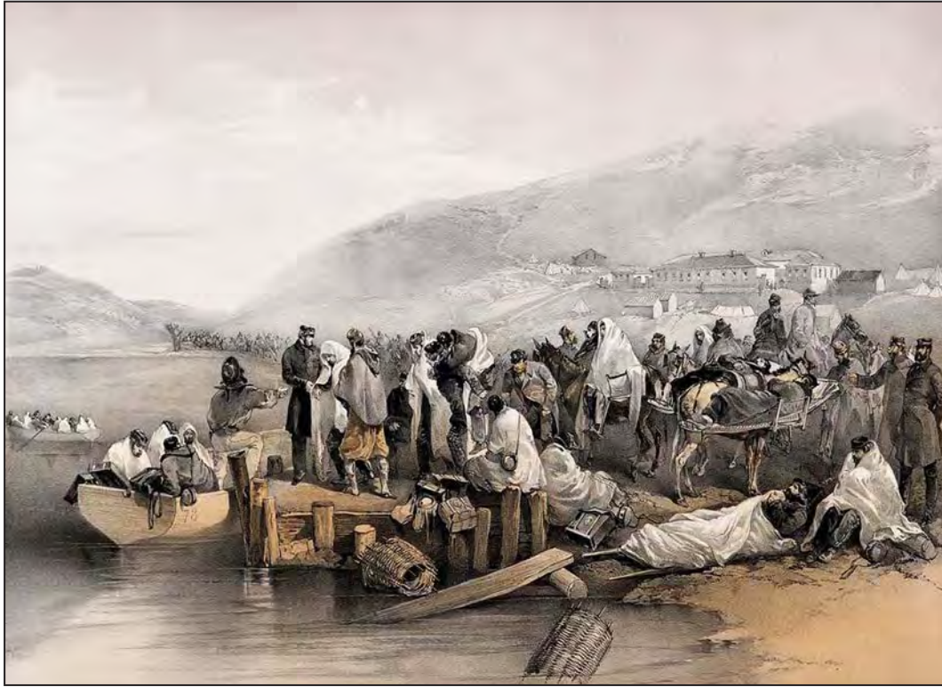
Yaralı ve hastaların Balaklava'dan nakli, Nisan 1855. (William Simpson)