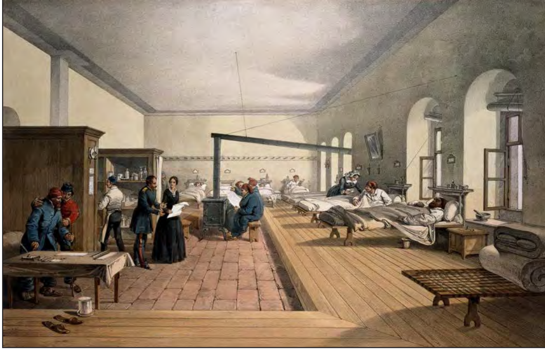
Florence Nightingale.