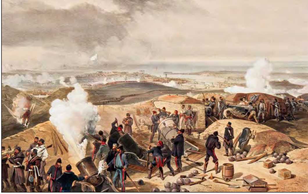
Sivastopol kuşatması. (William Simpson)