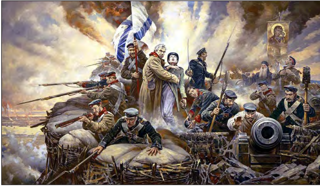
Sivastopol savunması, 1855