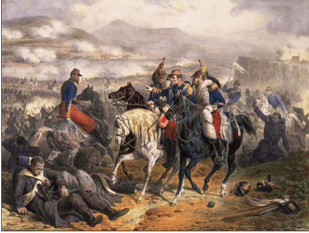
Alma Muharebesi, 20 Eylül 1854