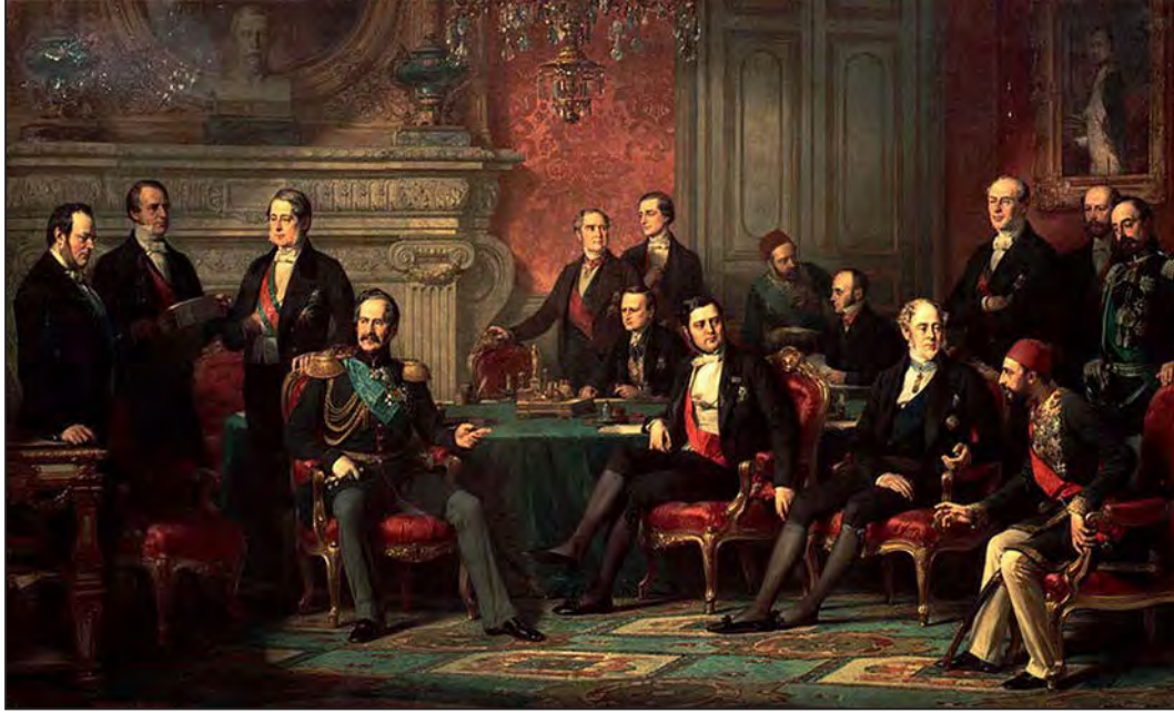
Paris Anlaşması, 30 Mart 1856. (Edouard Louis Dubufe)