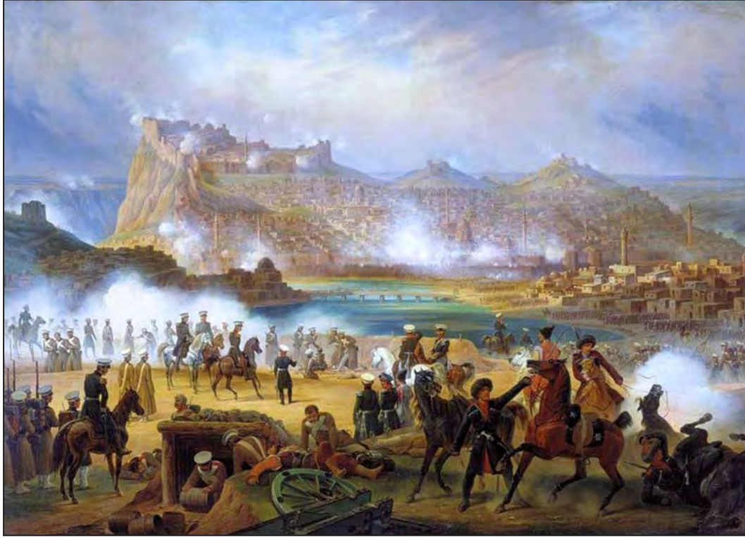
Kars Kuşatması, Temmuz 1855

29 Eylül, devamlı takviye alan Kont Mikhaıl Muravyov komutasındaki Ruslar yaptıkları saldırılarda birçok yaralı ve esir vermesine rağmen kuşatmayı sürdürdüler.