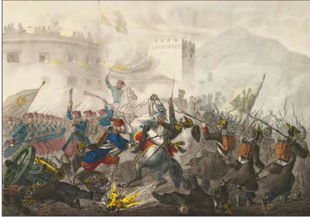
Silistre savunması, Mayıs 1854