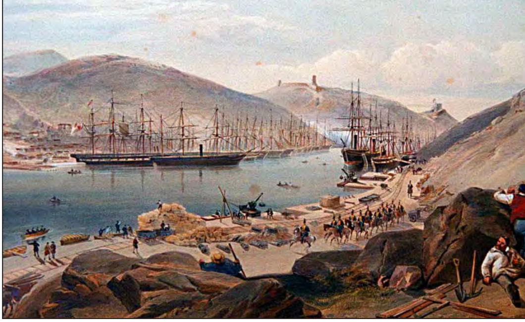
Müttefik gemileri Balaklava'da, Ekim 1854. (William Simpson)