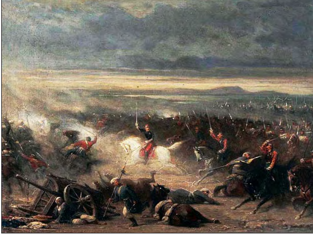
Gözleve Muharebesi, 17 Şubat 1855