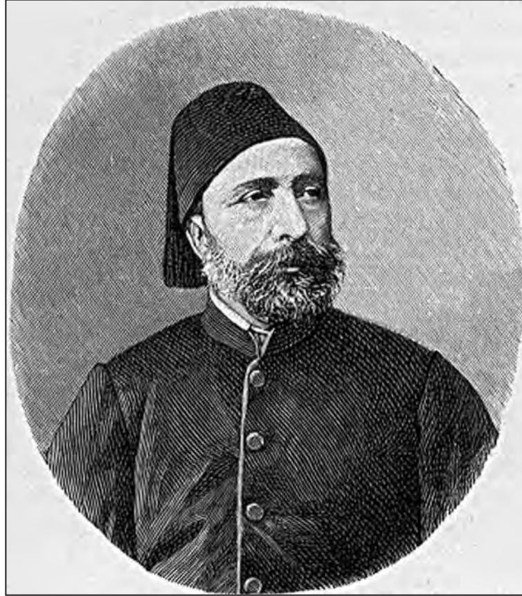
Mehmed Emin Ali Paşa