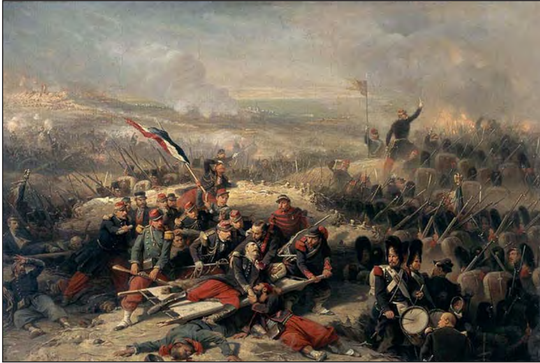
Malakoff Muharebesi, 8 Eylül 1855. (Adolphe Yvon)