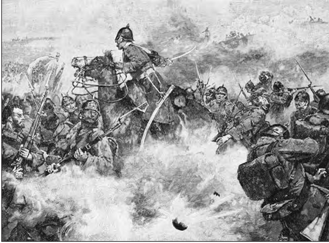
İnkerman Muharebesi, 5 Kasım 1854

9 Ocak 1855, Sardinya Kraliyet Meclisinde Kırım Savaşı'na katılmak için müzakereler başladı ve bir gün sonra İngilizler ile ittifak yapmayı öneren Kont Cavour'un teklifi kabul edildi.