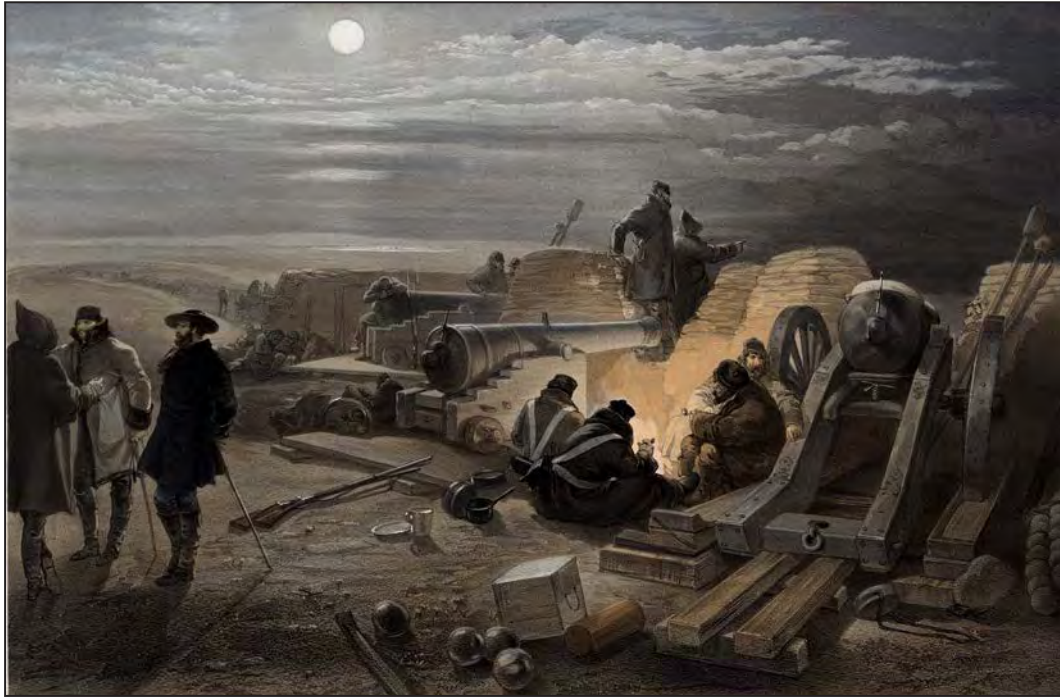
Siperlerde gece. (William Simpson)