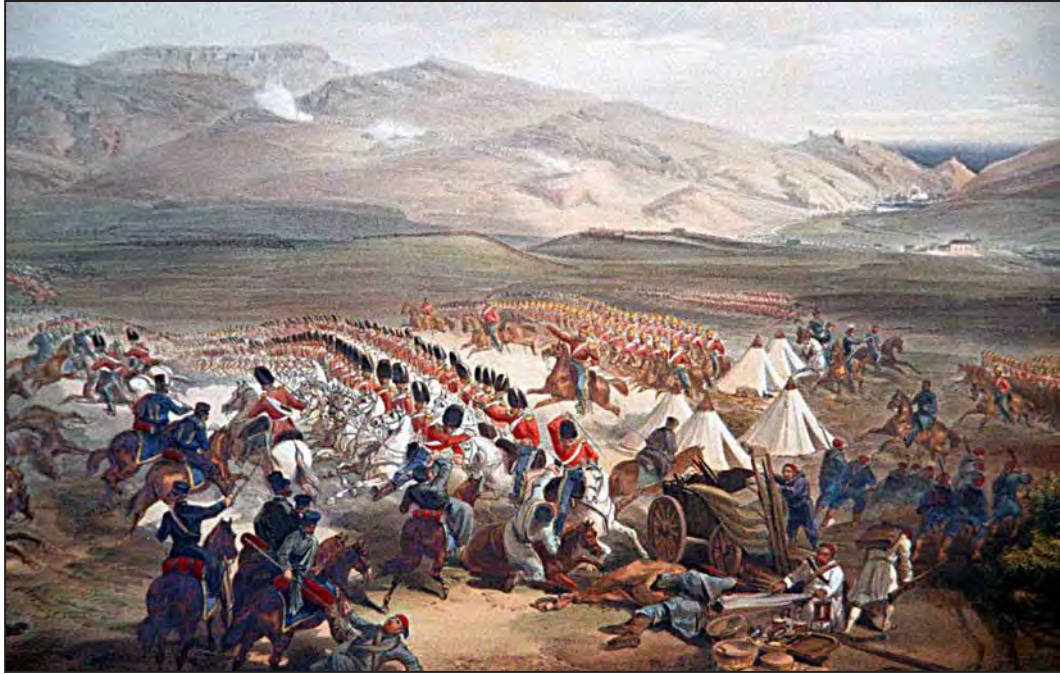
İnce kırmızı hat, Balaklava Savaşı. (William Simpson)