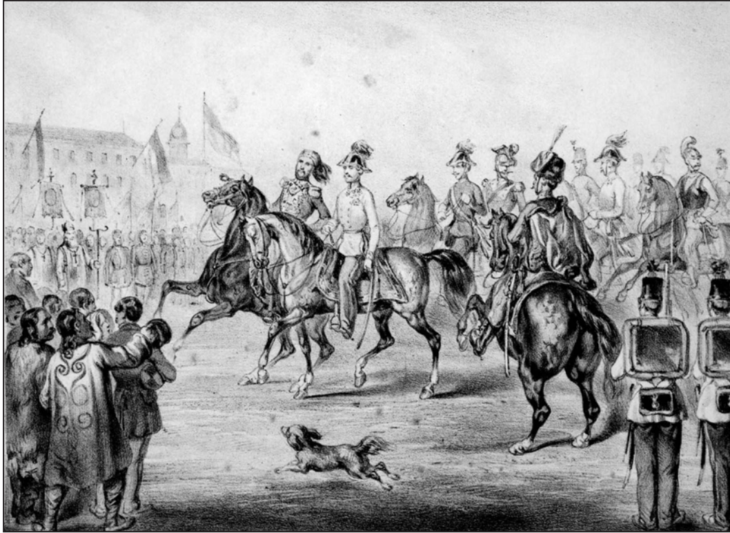
Avusturya birlikleri Bükreş'te, 6 Eylül 1854

8 Ağustos, Halim Paşa komutasındaki Osmanlı birlikleri Bükreş'e girdiler. 17 gün sonra tampon bir bölge oluşturmak isteyen Avusturya birlikleri de Bükreş'e gelmeye başladılar.