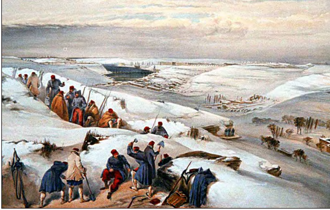
Balaklava'da kış siperleri. (William Simpson)