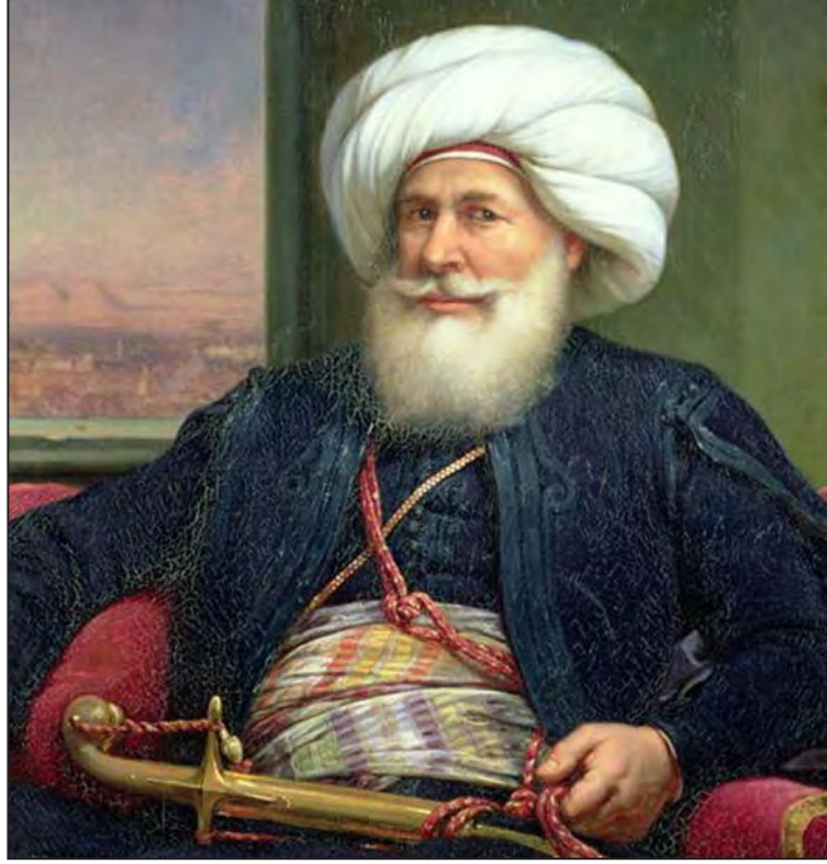
Kavalalı Mehmed Ali Paşa