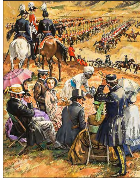
Savaşı izleyen İngilizler. (Leo Davy)