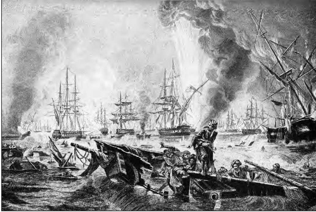
Sinop baskını, 30 Kasım 1853

30 Kasım 1853, Batum'daki birliklere mühimmat götürmek için yola çıkan ve fırtına nedeni ile Sinop limanına sığınan 12 tekneden müteşekkil Osmanlı filosu, Amiral Pavel Nakhimov kumandasındaki Rus filosu tarafından yapılan bir baskın ile tamamen yok edildi. Riyale (Tümamiral) Bozcaadalı Hüseyin Paşa ve 2.700 denizcinin şehit olduğu, 556 denizcinin yaralandığı bu baskında Filo Komutanı Patrona Osman Paşa ve 150 denizci de Ruslar tarafından esir alındı.