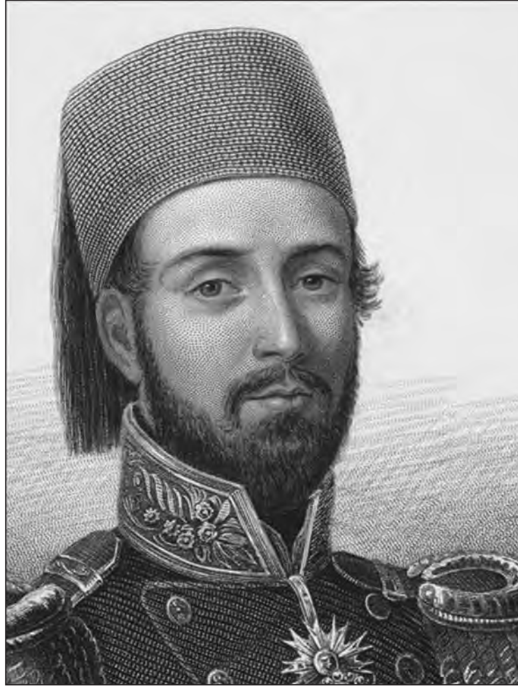
Sultan I. Abdülmecid

2 Temmuz 1839, II. Mahmut'un cenaze töreni sırasında Sadrazam Mehmed Emin Rauf Paşa'ya yeni padişahın kendisini azlettiğini bildiren Meclis-i Vela Reisi Koca Hüseyin Paşa, yeni Sadrazam olarak Mühr-ü Hümayun'un kendisine teslimini istedi ve 8 Haziran 1840 tarihine kadar bu görevi sürdürdü.