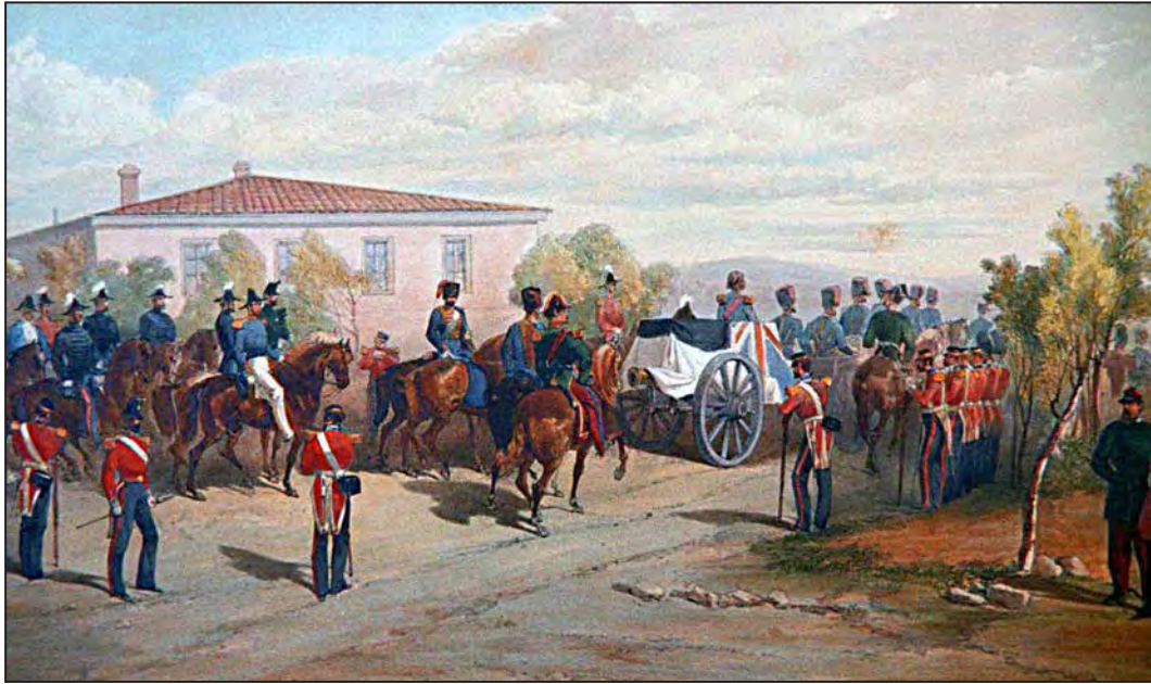
Baron Raglan'ın cenazesi, 29 Haziran 1855. (William Simpson)